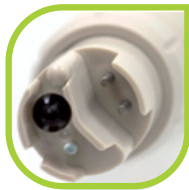
Une seule electrode pour 3 paramètres