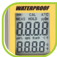
Grand Ecran LCD