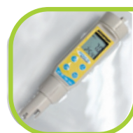
Etanche Certifié IP67

Mesurer le pH, La conductivité et la température avec un seul bouton de sélection et une seule électrode !