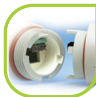
Electrode de rechange disponible Elle se clique simplement (sans outils)